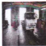
Foto Belakang Image Rear